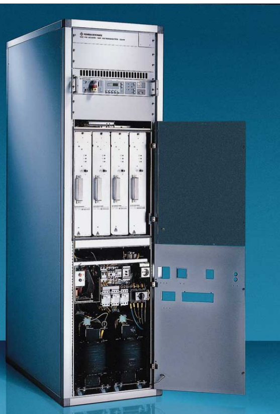
BILD 1 10-kW-VHF-FM-Transistorsender SR610E1. Foto 43077/3

Im Vierfach-Teiler wird das modulierte HF-Signal in vier identische HF-Signale mit einer Leistung von jeweils etwa 5 W geteilt und anschließend den VHF-