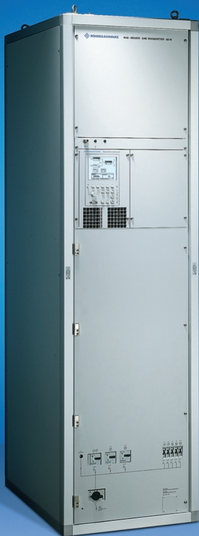
BILD 1 Die DAB Sender aus der Serie NA6.../NL6... überzeugen durch ein ausgeklügeltes Konzept zur Kostensenkung in großen Netzen.